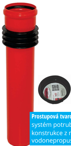
Prostupová tvarovka Typ BDF systém potrubí KG/HT konstrukce z monolitického vodonepropustného betonu