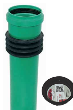
Prostupová tvarovka Typ BDF –KG 2000 systém potrubí KG 2000 konstrukce z monolitického vodonepropustného betonu